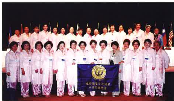
》參加雙年會一群來自台灣的蘭馨姊妹，在會場與來自不同國家的蘭馨姊妹大家相聚一堂，雖然語言不通，我們以微笑、擁抱、交換禮物，表達我們熱情的友誼

SIA 前任會長與大會主席伊凡麥崔可，首先歡迎來自各國超過 1,486 個姊妹會，前來參加這次在加拿大卡加利市舉行的第 38 屆雙年會，會中介紹 SI 的執行長羅絲考茲，SIA 執行長萊文茲，SIGBI 主席安卡維與安艾絲滌席，SI 瓊安克洛瑪與維多利亞霍布斯。會議期間除對婦女各項議題進行研討，如：計劃推動長期的預防家暴防治工作，進行社會對家暴本質的認知，未來有效建立整體的防治工作。籌募經費計畫等，參加桂冠會員代表大會上被特邀參加她們安排的專門活動，桂冠協會活動是大會的壓軸節目，大家穿著各式各樣睡衣，手持著葡萄酒杯、美食佳餚……，雖然語言不通，每個人都以微笑來表達感情的流露，互相拍照留念，渡過一段難忘的時刻。