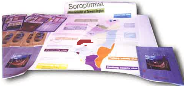
》中華民國總會於雙年會展示台灣區簡介

小檔案 「國際婦女交流協會」於西元一九九一年由日本高松總會創辦，分別在台北、台中、高雄成立三個分會，於一九九五年統一命名為「國際婦女交流協會」中華民國總會，並於同一年成立台灣分會，直隸該會大會。