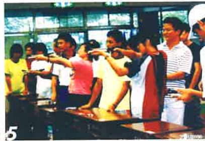
4 台東縣會秋節聯歡中由防火宣導隊教導姊妹防火常識