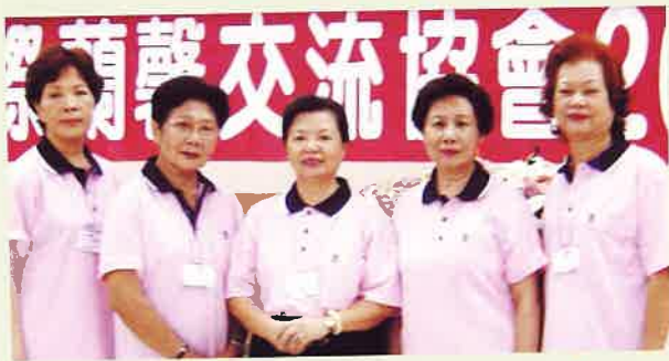
》南投縣分會幹部攝於劍潭青年活動中心幹部訓練營

募款則未必，例如募月餅，半價買來，開收據要記得扣除捐款部分。成果報告要附 DVD 及照片四十張以上。最後還附有外交標準禮儀，告訴我們如何安排客人之抵達、開會用餐及送行程表與翻譯。正好學習地主國為接待外賓作準備。