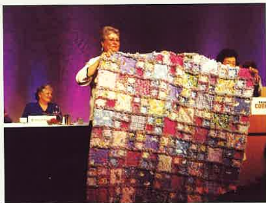
》女青年志工獎得獎者贈 SIA 藝術拼圖作品

婦女機會獎始於一九七二年，在過去三十多年來曾經幫助了超過兩萬名的單親婦女，繼續深造接受高深教育創造自己事業，她們總共接受了美金一千伍佰萬元的獎金。