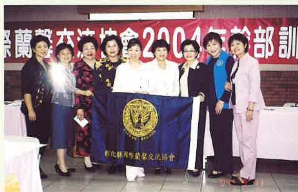
》彰化縣分會參加2004年幹部訓練營

蘭馨會的宗旨是，犧牲奉獻、服務社會、造福鄉里，聯合全世界職業婦女聯盟，提昇婦女在法律，政治、經濟及職業上之地位，與政府間及其他組織