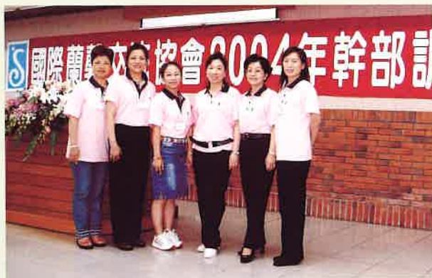
》參加國際蘭馨交流協會 2004 年台灣區幹部訓練

合作，以促進並獎勵世界各國設立蘭馨會，並發揚蘭馨服務精神，團結各界婦女領袖，共同謀求國際間之了解與友誼，促進世界和平。