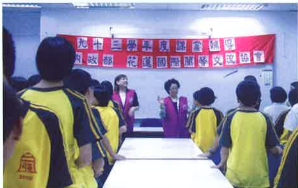
》花蓮縣會舉辦「關懷學童課後輔導活動」

花蓮縣分會在今年九月、十月分別啓動兩項深具意義，充分彰顯蘭馨愛心精神的活動，第一項為贊助愛心便當；第二項為單親家庭低收入國中、生開辦課輔班。在開學後，國立花蓮女中訪查出二十二位生活有困難的學生，運用各種社會資源幫助她們完成學業，並在校園中發起「愛心便當」贊助活動，花蓮縣國際蘭馨交流協會捐助三萬三千元，師生亦踴躍捐款，合作幫助困苦學生每天中午都有飯吃，免於空腹捱餓上課。