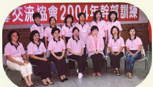
》台中縣會參加2004幹部訓練營

(二) 自我肯定：無法改變自己的部分就要悅納接受，也不要怕承認自卑，自卑是上進原動力之一，自己心中的我要和周遭親友心中的我，愈接近愈好。自我肯定的方法有：