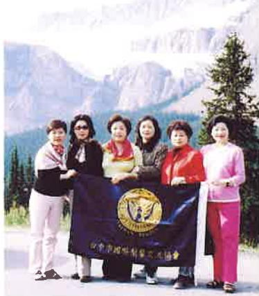
》台中市分會代表團

當然，除開會外，另有豐富而輕鬆的心靈之旅。伊麗莎白女皇公園景觀設計富貴族優雅風格，史丹利公園印地安圖騰，遠古又原始的野性呼喚，及加拿大冰河國家公園，四百餘條大小冰河匯集，展現出造物者之神奇奧妙，都讓我們印象深刻。尤其是搭乘冰原巨輪雪車，登上阿塔巴斯卡冰原觀賞萬年冰河奇景，那種置身萬年時光隧道的感覺，非親身經歷難以體會。