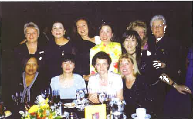
》SIA 各專區總監攝於雙年會晚宴