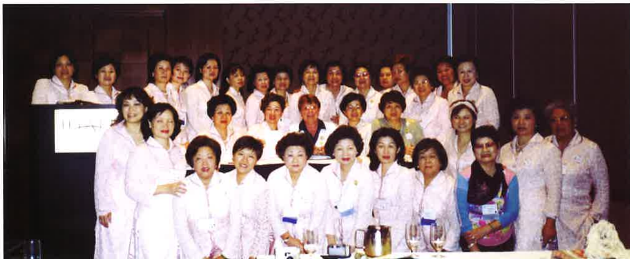
》分組研討—台灣專區全程熱烈參與

國際蘭馨交流協會中華民國台灣專區是唯一能以「中華民國青天白日國旗」進入聯合國非政府國際會議的組織，此次參加雙年會在大會會場，當大家熱情洋溢齊唱國歌、高舉國旗時，全體會員激動落淚。