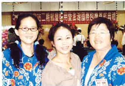
1 澎湖縣會參加澎湖澳門首航典禮