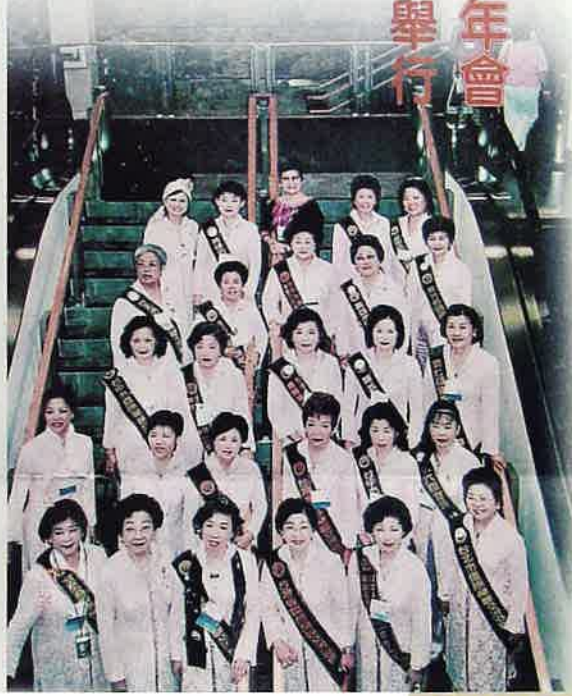
▲ 國際婦女交流協會中華民國總會代表團一行抵達加拿大卡加利市會場。

據「國際社會」國家及國際二會暨而成立的國際婦女交流協會，自一九五二年成立以來，已有一百二十多個國家和地區陸續加入，全球會員人數高達十萬餘人。其中，SIA 中華民國總會在台灣已成立了二十一個分會，共約五百多名會員。在國內所有已加入的政黨和團體中，是以前唯一能以「中華民國青年日報」加入。進入聯合國非政府組織的民間組織。本屆會議上，來自台灣的團體代表團，許多會員都將參加，並帶動地帶下發展。