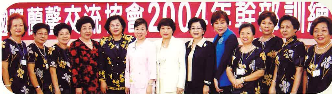
》南投縣分會 幹部訓練與總監及歷任總監合影