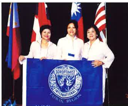
》當中華民國國旗豎立在加拿大會場，我們三人苗栗縣分會（母會）、新竹縣分會（子會），拉起了蘭馨的會旗，此時此刻，我們感到多麼喜悅與驕傲呀！