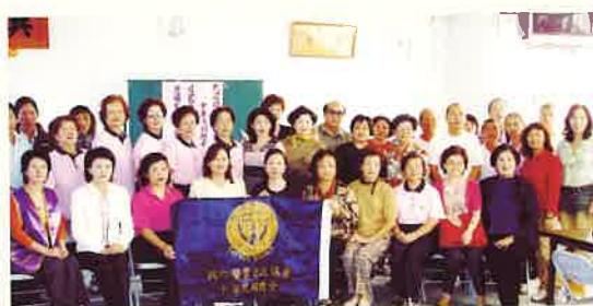
》許總監暨 SI 會員將捐款送予山城四鄉鎮災民手中

其他壹拾萬元將由南投縣會會長及會員擇日交予災民手中，另外玖萬伍千元留待用於新竹縣賑災之用。