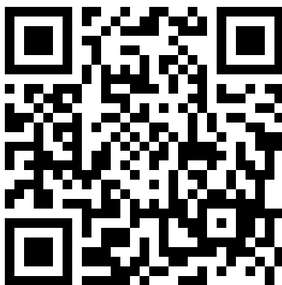
網路報名 QR code