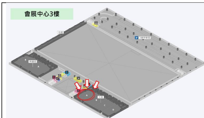
會議室地點示意圖